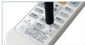
電池収納部にボタンがある場合もある